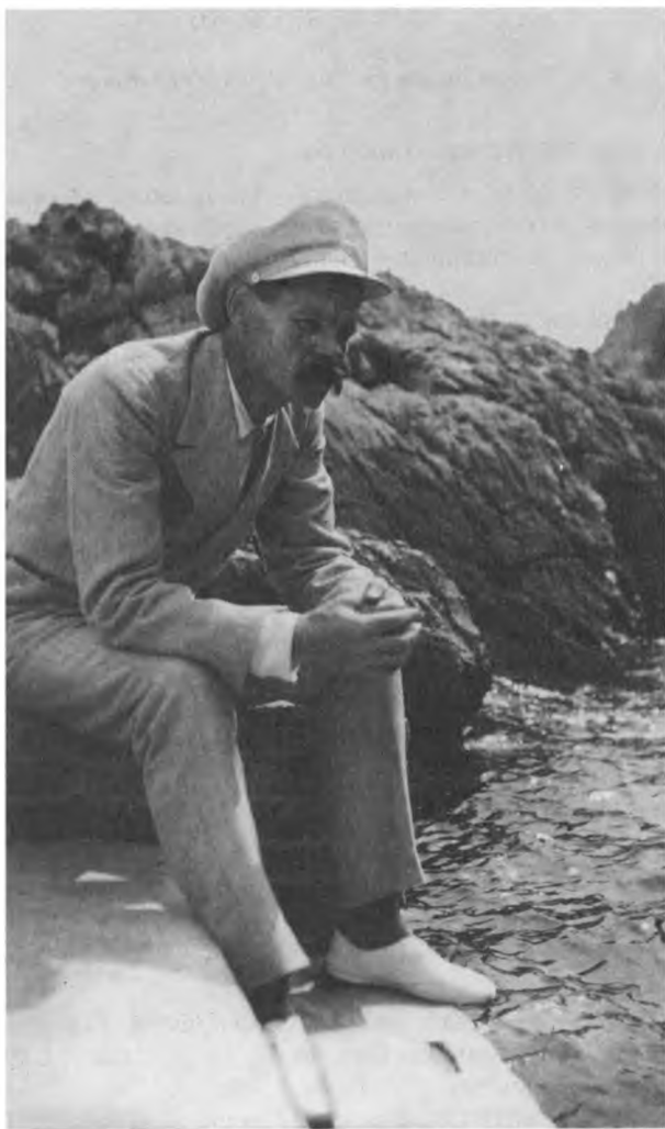
М. Горький на берегу. Капри. Апрель 1912 г.