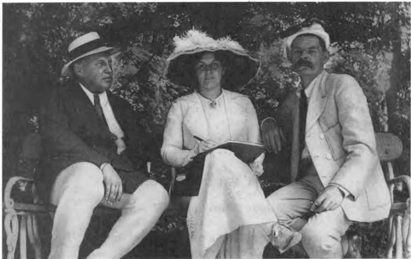
Н.А. Румянцев, М.Ф. Андреева, М. Горький. Капри. Июнь–июль 1912 г.

поможет Вам поставить разговор с “Р(усским) С(ловом)” вполне определенно 4 .