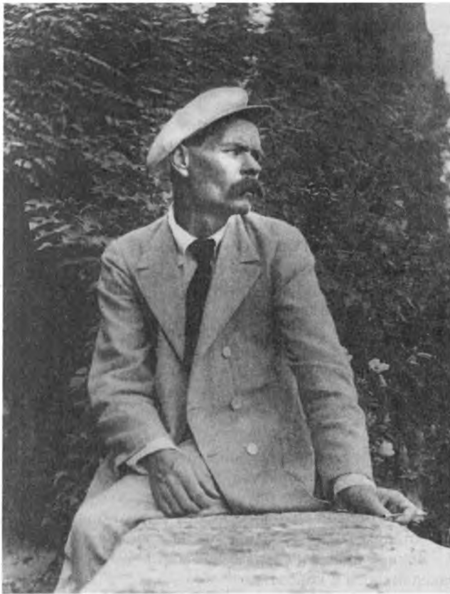
М. Горький. Капри. Июнь 1912 г.

Вчера неожиданно получил письмо от Бориса Морковина – помнишь – “Чемодана” 6 ? Четыре года не знал я, где он, и думал, что парень погиб, а он – кончил Пражский университет, получил звание лектора по рус. языку, бодр, весел и едет в Россию, легализируется. Такое славное письмо.