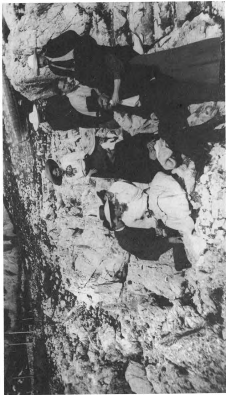
М. Горький с гостями в гроте. Капри. 1911–1912 гг.