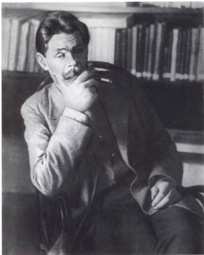
М. ГОРЬКИЙ. Капри. Декабрь 1911 г.